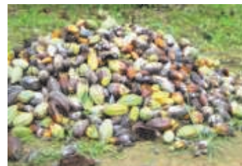
Figure 3. Résultat d'une récolte sanitaire

Mettre en sacs les cabosses et les résidus issus de la récolte sanitaire pour les sortir de la plantation.